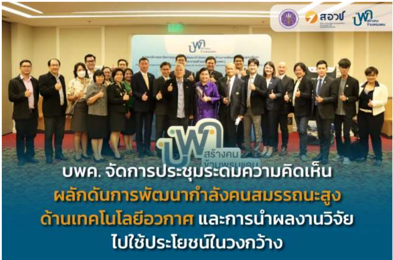
ภาพผู้เข้าร่วมการประชุมฯ

https://www.facebook.com/100078024085713/posts/199495235994611/?mibextid=cr9u03