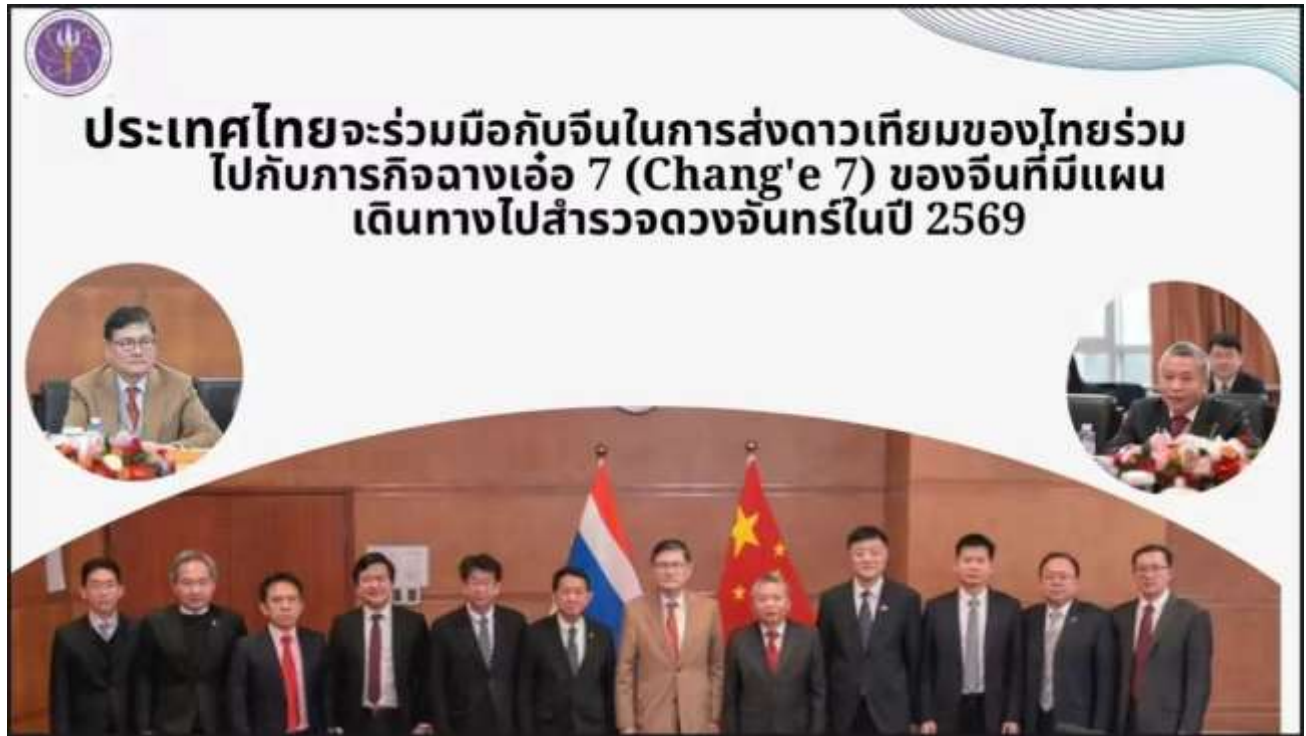
ภาพผู้ร่วมประชุมความร่วมมือที่ China National Space Administration (CNSA) ณ สาธารณรัฐประชาชนจีน

https://www.facebook.com/MHESIthailand/posts/pfbid0o59LSto6tKMUoSiSgoNRTpsu3JZUvTnoHLxPa7bFXNvk6yomdA2EYtJzZtq2DtU8l